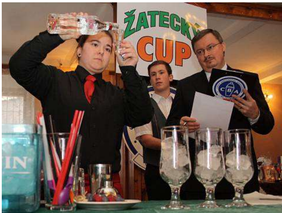
Žatecký CUP 2016