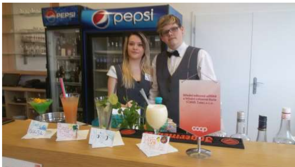
Stop and Stay 2016