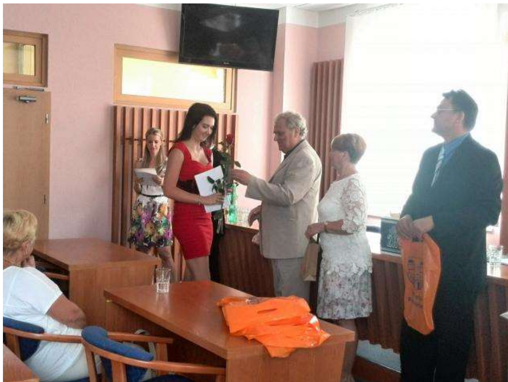
Dobry list komory