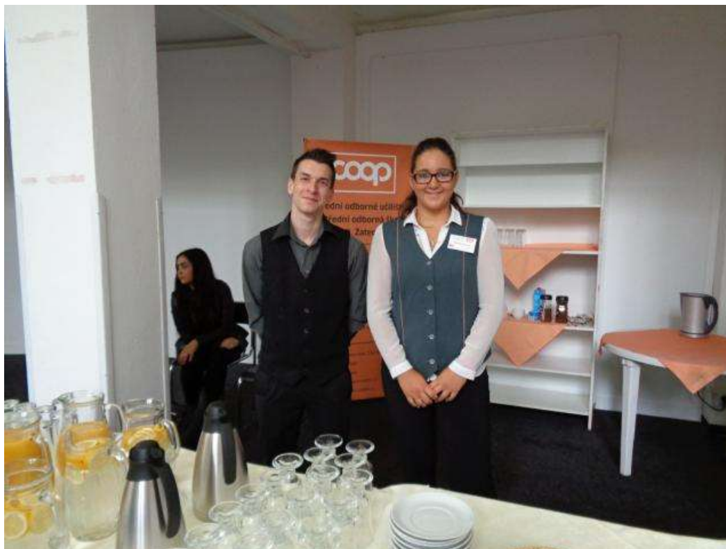
Den záchranářů Ústeckého kraje 2016